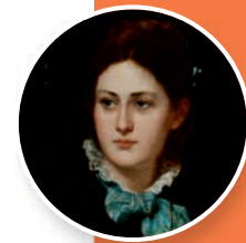
Gabriele Reuter 1859-1941