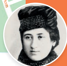
Rosa Luxemburg 1870-1919