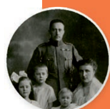
Großherzog Wilhelm Ernst von Sachsen-Weimar-Eisenach 1876-1923