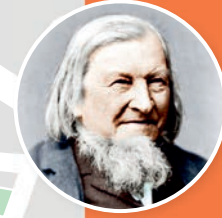
August Heinrich Hoffmann von Fallersleben 1798-1874